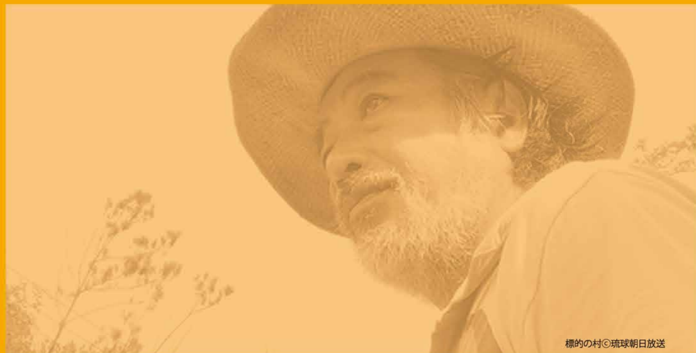
標的の村