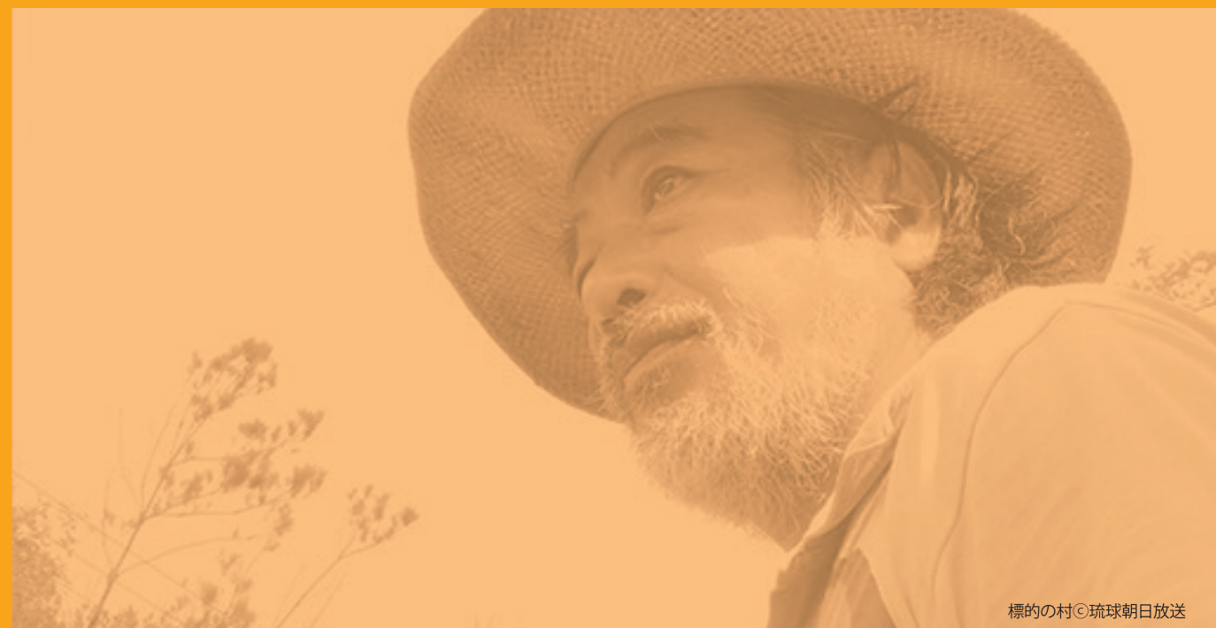
標的の村